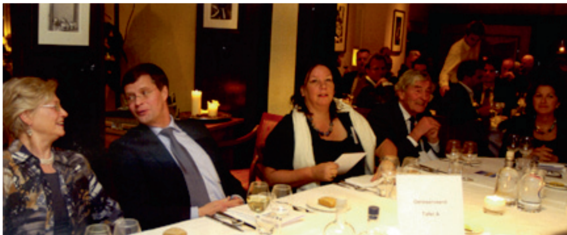
V.l.n.r. Oud-minister Maria van der Hoeven, oud-premier Jan Peter Balkenende, FNV-voorzitter Agnes Jongerius, oud-premier Ruud Lubbers en staatssecretaris Marlies Veldhuijzen van Zanten van Volksgezondheid