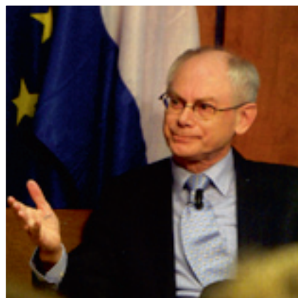
Volgens Herman van Rompuy, voorzitter van de Europese Raad, moeten we positief blijven over Europa. 'Ons lot is nauw verbonden'