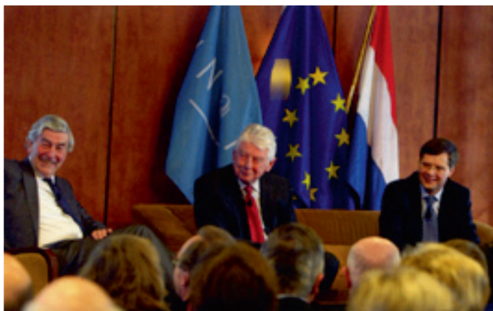
Oud-premiers Ruud Lubbers, Wim Kok en Jan Peter Balkenende maken zich zorgen over het populisme. 'Ondernemers hebben ook een rol en moeten niet achterover leunen'