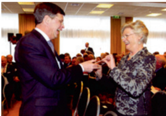
Oud-premier Jan Peter Balkenende en oud-minister Maria van der Hoeven, tegenwoordig directeur van het Internationaal Energie Agentschap in Parijs

Kijk ook naar de ForumVideo over de Bilderbergconferentie op www.vno-ncw.nl en bezoek www.bilderbergconferentie.nl