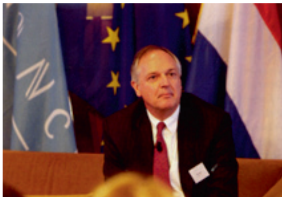
Paul Polman, ceo van Unilever: 'Het is in niemands belang de wereld te verpesten'